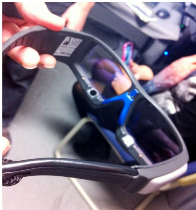
Eye tracker naočale